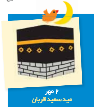
۲ مهر عید سعید قربان