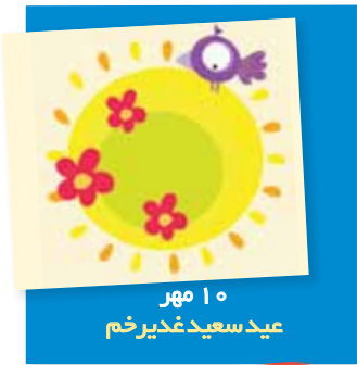
۱۰ مهر عید سعید غدیر خم