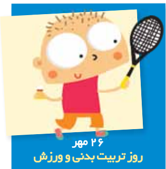
۲۶ مهر روز تربیت بدنی و ورزش