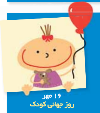
۱۶ مهر روز جهانی کودک