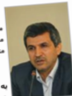
به نام خدا

مراسم اختتامیه «نهمین جشنواره کتاب‌های آموزشی رشد» در سالن همایش‌های پژوهشکده و هنر معماری جهاد دانشگاهی به پایان رسید.